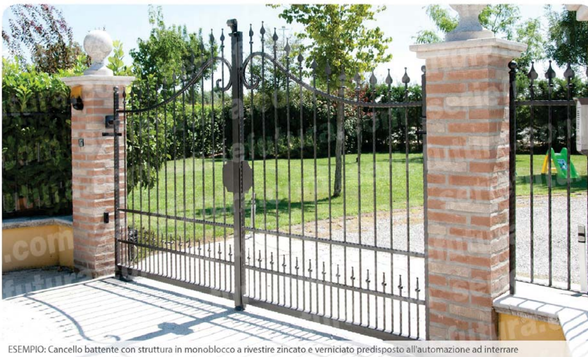
ESEMPIO: Cancelli battenti con struttura in monoblocco a rivestire zincato e verniciato predisposto all'automazione ad interrare